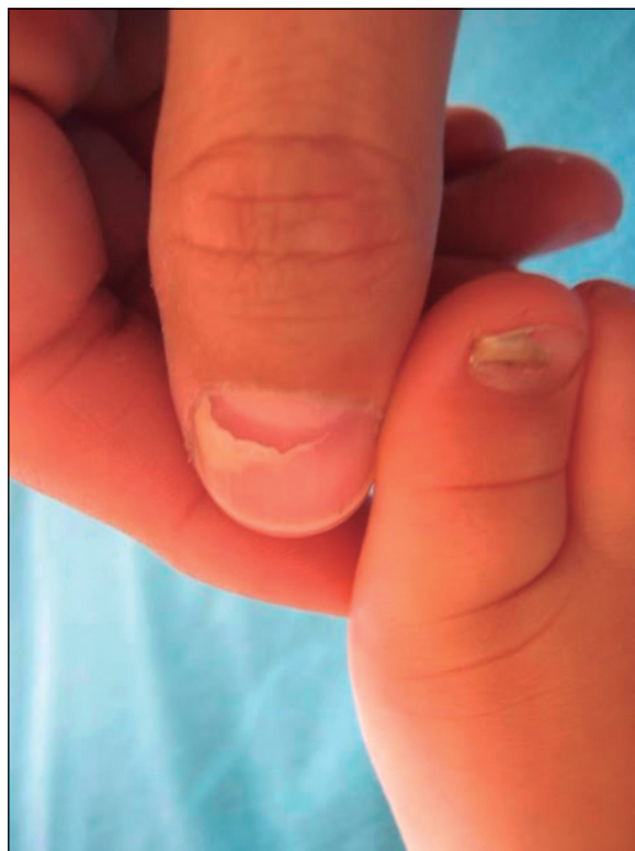
Figura 2. Onicomadesis presente en padre e hijo afectados por la misma virosis.

El diagnóstico de onicomadesis es clínico, por lo cual es fundamental realizar una acuciosa anamnesis dirigida a buscar las asociaciones previamente descritas. Sólo sería necesario realizar exámenes comple-